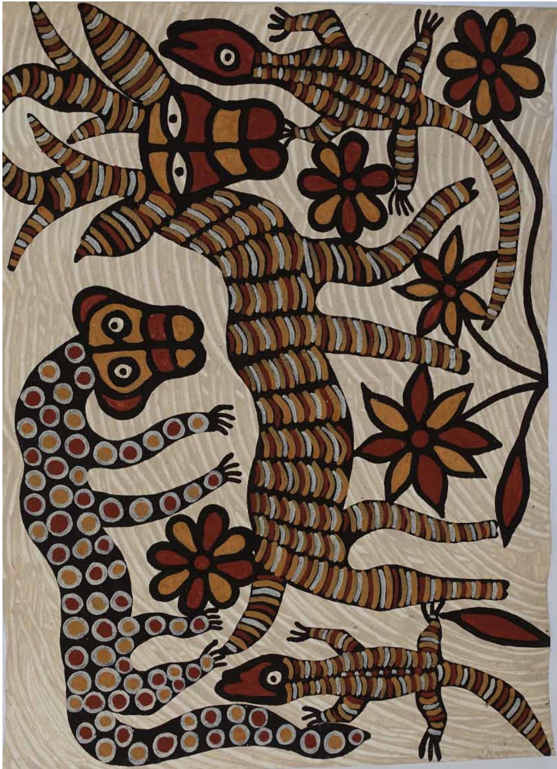
De gauche à droite et de haut en bas : un guépard, une fleur, un lézard, un zébu, une fleur, un lézard.