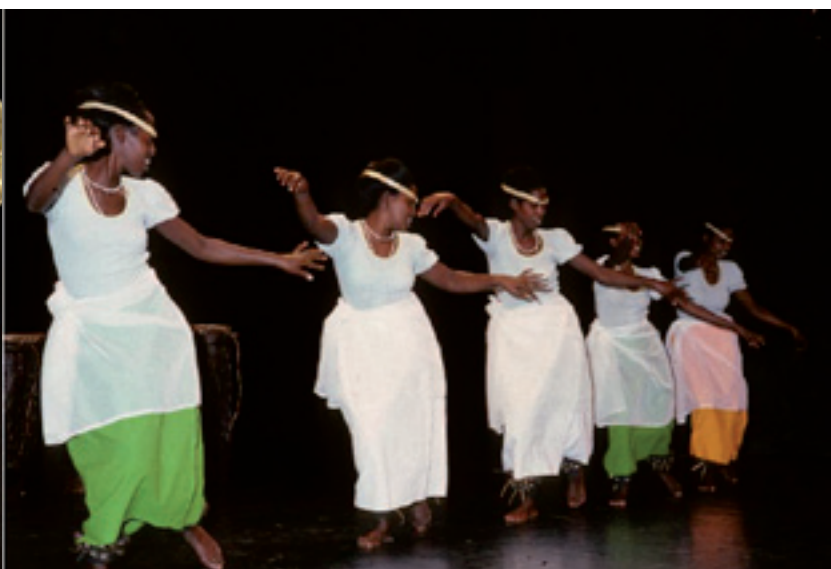
Percussions du Rwanda, ensemble Amasimbi n'Amakombe. Danse du Rwanda.