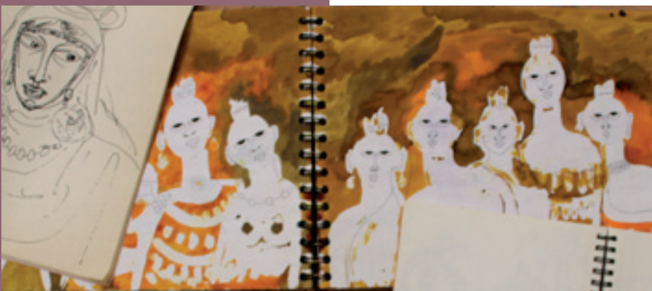
Carnets de terrain de Françoise Gründ

Textes réalisés à partir des notices de la base de données Ibn Battuta (Maison des Cultures du Monde)