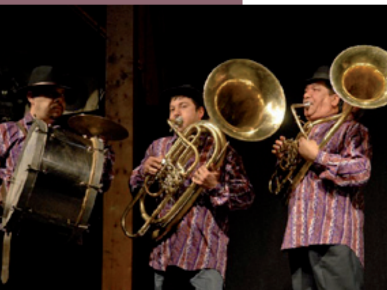
Roumanie. Taraf de Transylvanie. Fanfare Shukar de Moldavie.