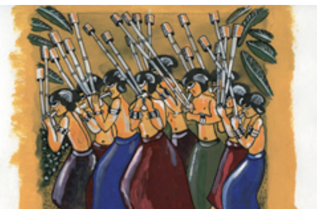
Dessins originaux des pochettes des CD INEDIT de Françoise Gründ © MCM / 2012